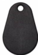
ATS1457 - Aritech - Tessera MIFARE PA6 Nero 10pz

Tag di prossimità MIFARE DESFire EV2 (CSN e UTC) 13,56 MHz. Utilizzabile in secure mode sui lettori della serie ATS118x. Se utilizzato con altri lettori Mifare viene fornito lo standard Mifare 7-byte CSN. Memoria da 2K, IP66, in plastica ABS, colore nero, forma arrotondata. Confezione da 5 pezzi.