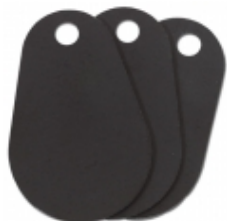
ACT430E-5 - Aritech - Tessera Mifare Std 1k 5pz

Tessera Mifare Standard S50 7-byte UID, confezione da 25 pezzi