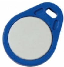
ATS1453 - Aritech - Tessera MIFARE ABS Blu 5pz